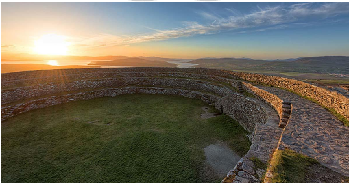
Grianan of Aileach

Justo pasando la frontera entrando en la republica nos encontramos con un majestuoso anillo de piedras, Grianan of Aileach.