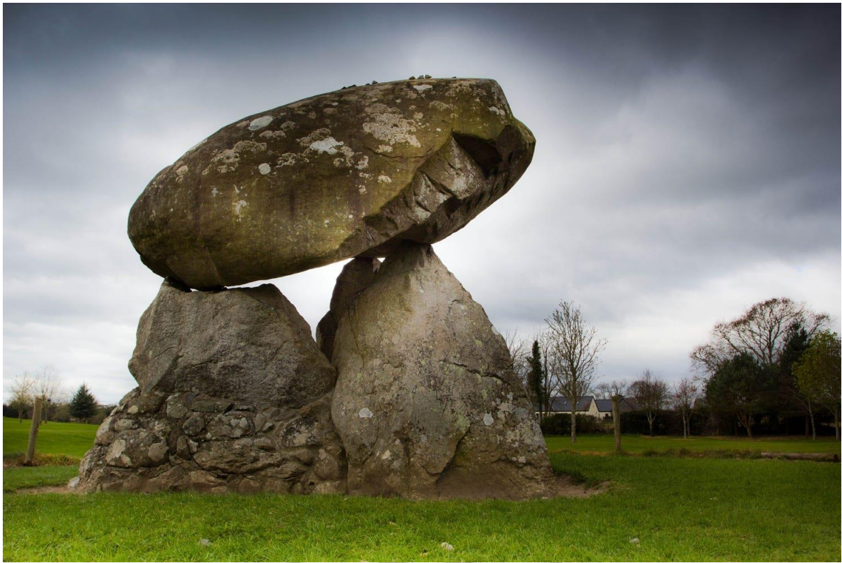
El Dolmen de Proleek

19:30 Dukes @ Queens en el corazón de Belfast