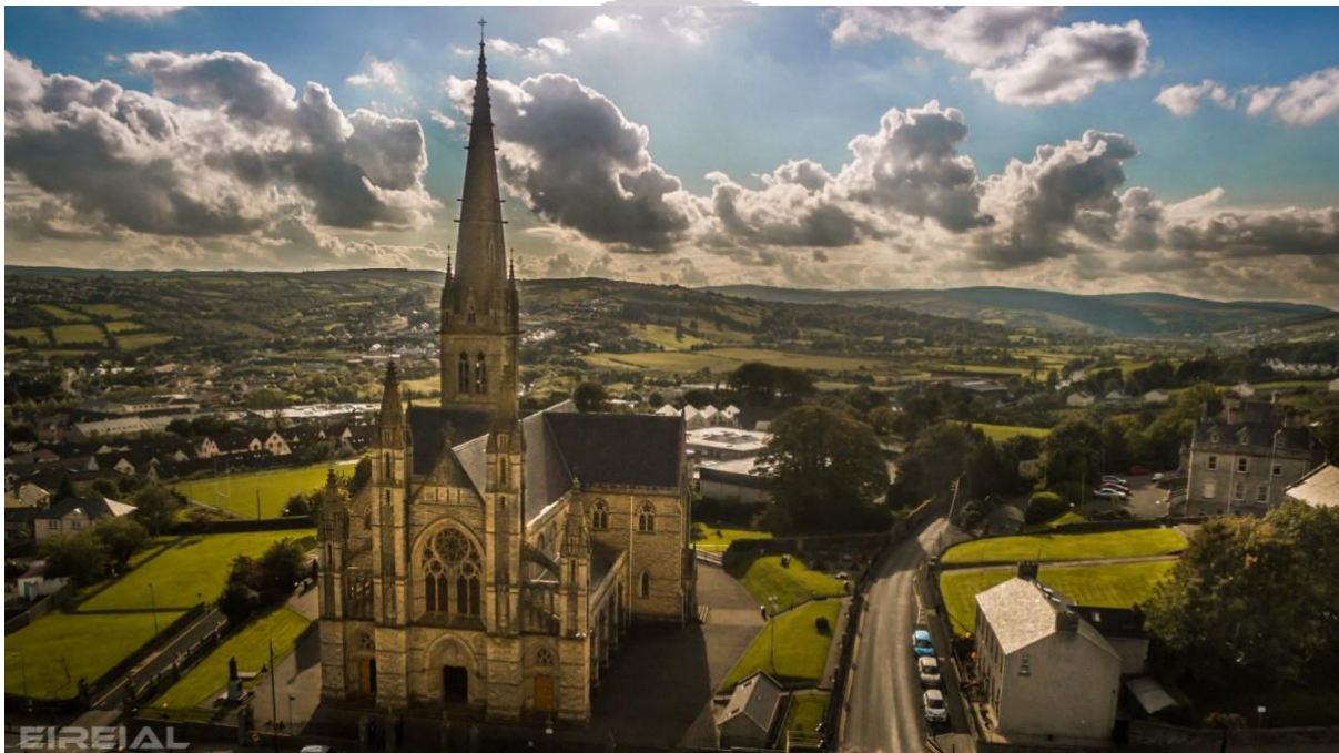
Catedral de Letterkenny

12:30 La ciudad de Letterkenny es uno de los destinos de Irlanda es muy interesante para poder conocer parte de su patrimonio, siendo la Catedral de San Eunan o St. Eunan's Cathedral como uno de los atractivos de la arquitectura religiosa de la zona y se encuentra ubicada en un lugar de la ciudad muy importante.