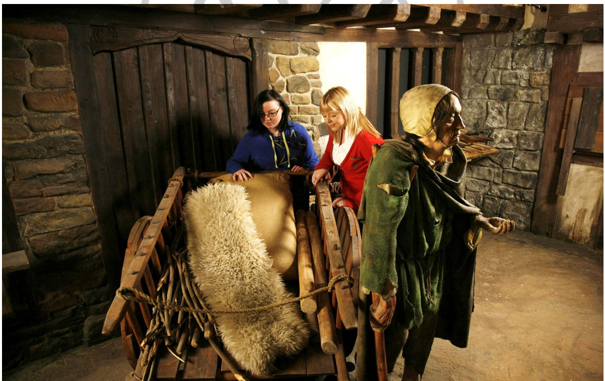
Dublinia (Museum Vikings)

19:00 Cena* y alojamiento en Marine Hotel Dun Laoghaire Se despide del guía y del chofer.