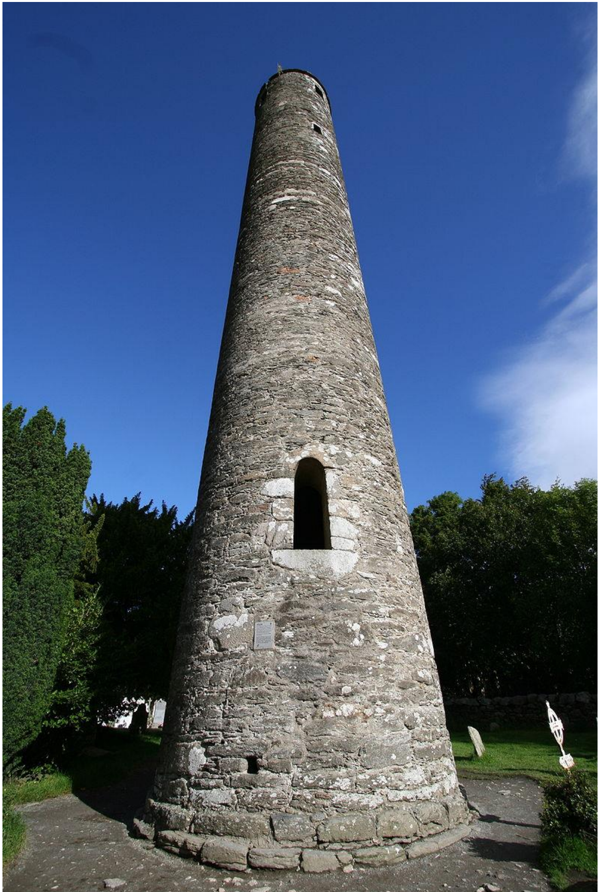
La torre de Glendalough