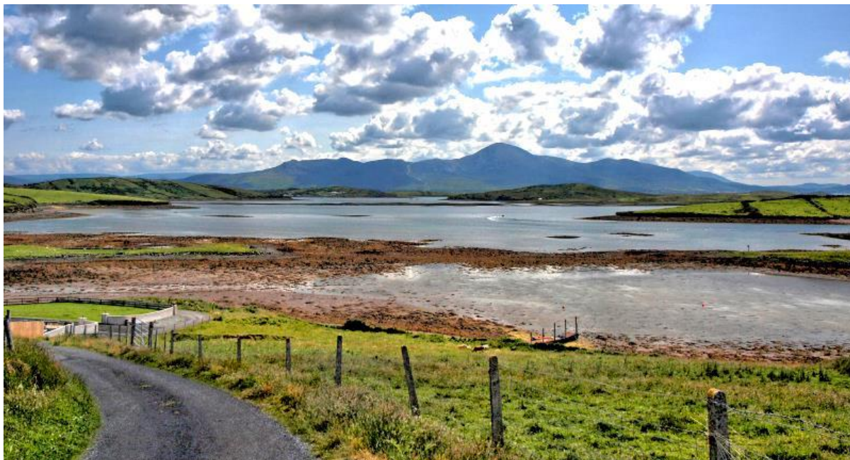
Clew Bay Panorama

10:30 Salida 165 km Impresionante belleza natural: El Connemara