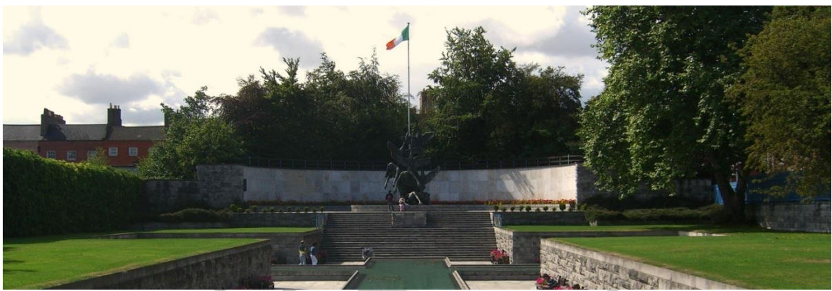
Garden of Remembrance