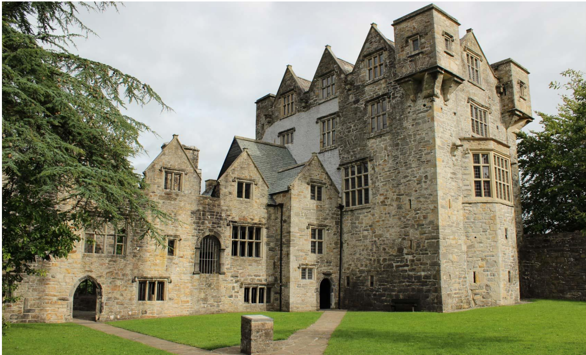
Castillo de Donegal

Es característica en el centro la plaza llamada the Diamond, ya que tiene forma de diamante. De notable interés son también el Donegal Castle cerca de la plaza, y la colindante iglesia con la torre del reloj. Situada en la carretera de Derry, existen las ruinas de lo que fue una abadía franciscana.