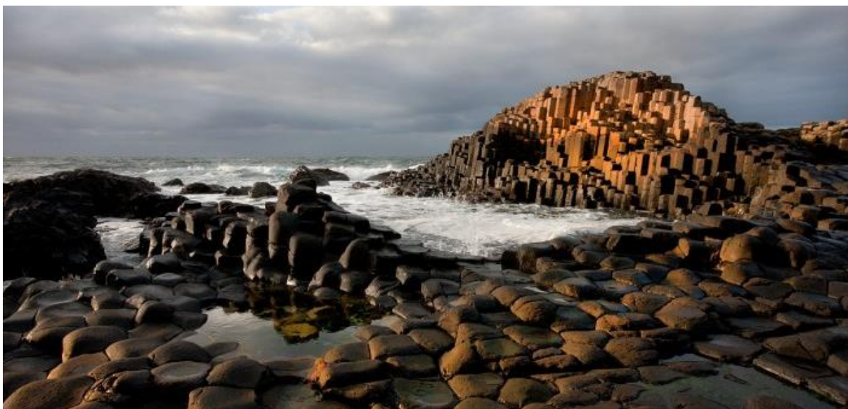
Calzada del Gigante

Justo abajo del castillo nos encontramos con la calzada.