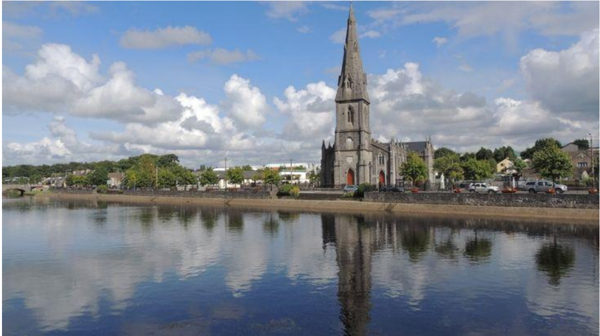
Ballina Condado de Mayo