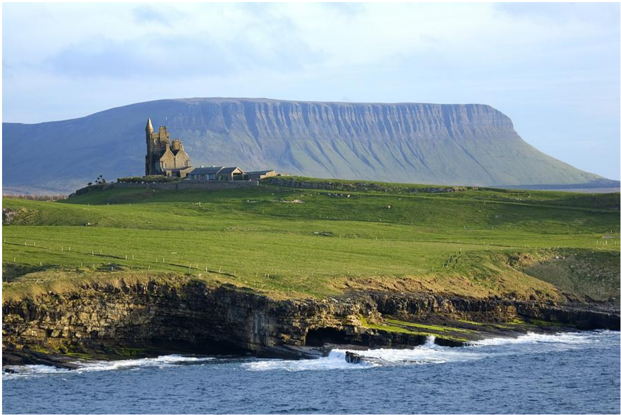
11:00 Breve parada en Sligo