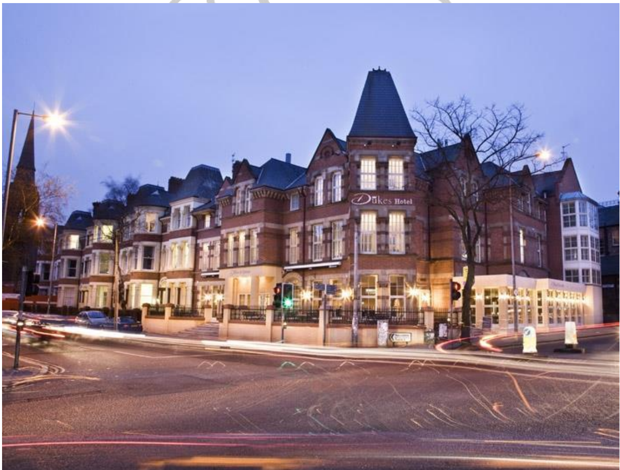
Habitación y desayuno en Dukes @ Queens

19:30 Dukes @ Queens en el corazón de Belfast