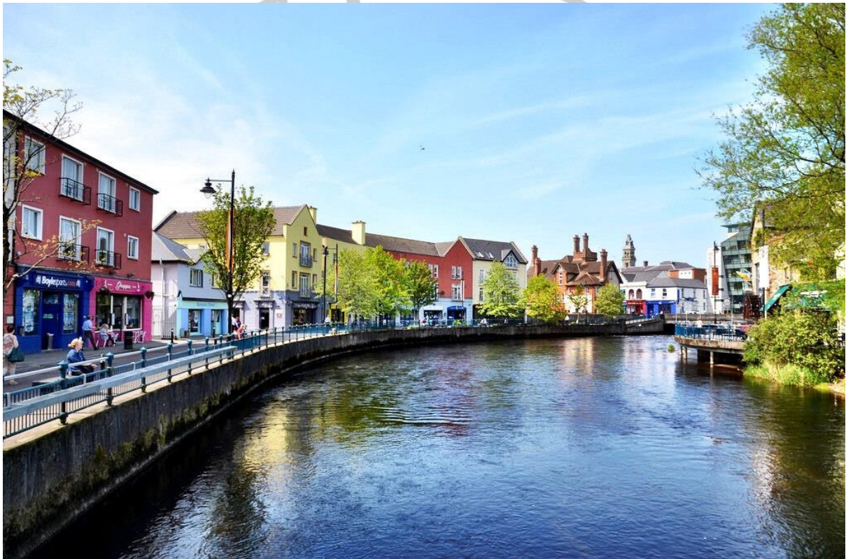
Sligo Ciudad en el condado de Sligo